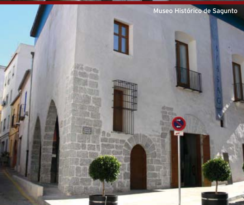
Museo Histórico de Sagunto