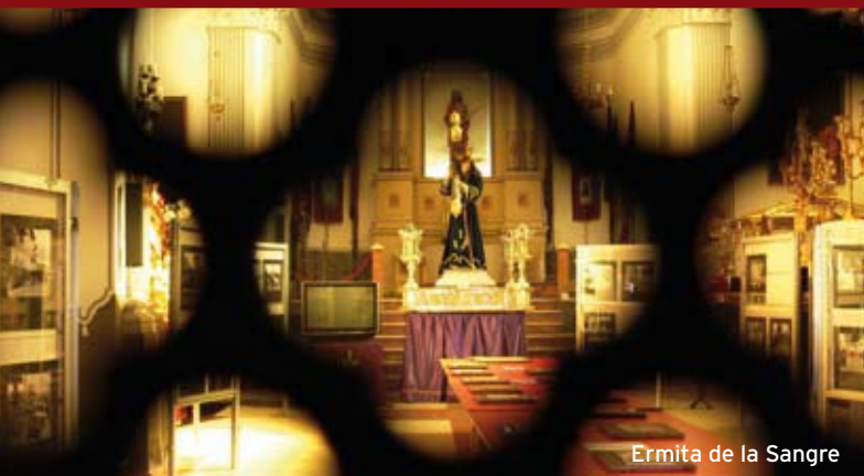
Ermita de la Sangre