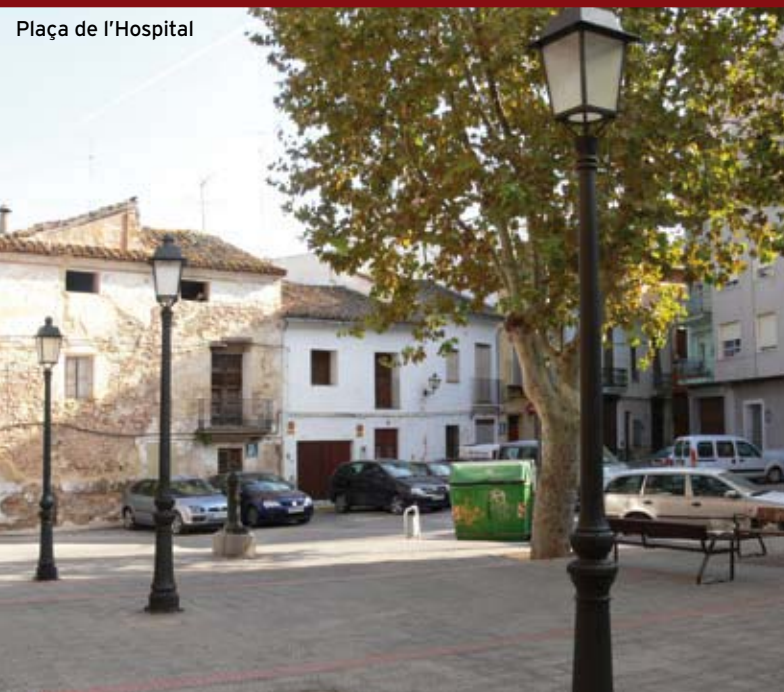
Plaça de l'Hospital