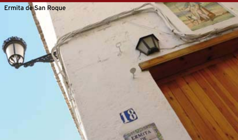
Ermita de San Roque