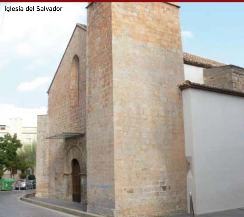
Iglesia del Salvador