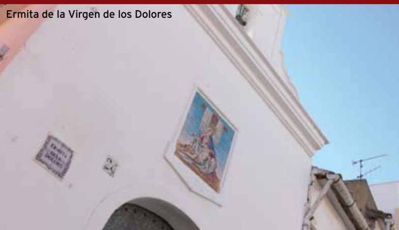
Ermita de la Virgen de los Dolores