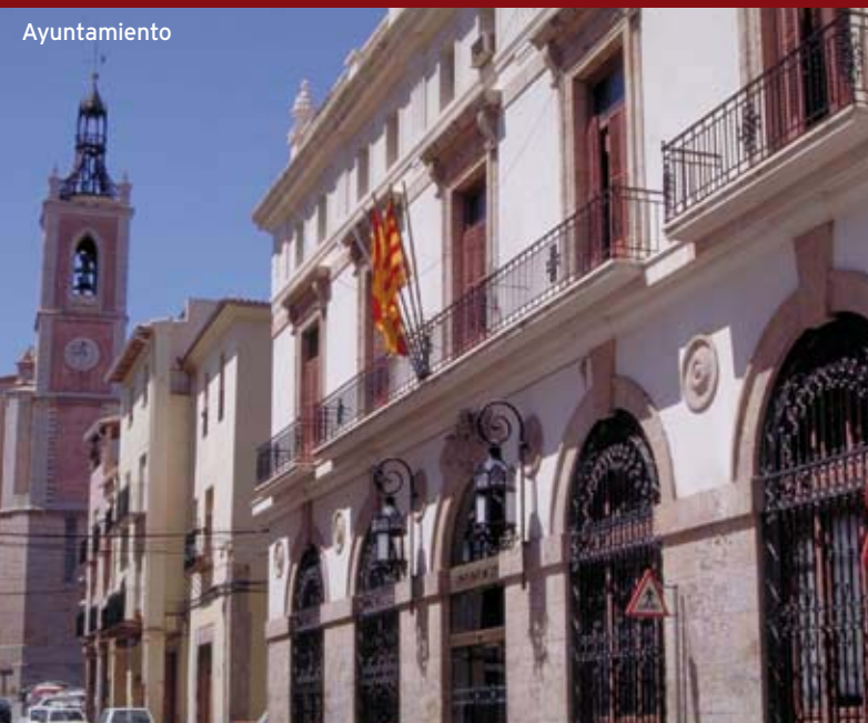
Plaça de la Peixcatèria