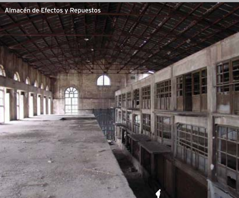
Almacén de Efectos y Repuestos

En 1916, comienza la explotación del embarcadero para transporte comercial (naranjas). Además, aprovechando la demanda de hierro por parte de los países en guerra, se constituye en 1917 en Bilbao, la Compañía Siderúrgica del Mediterráneo, para elaborar hierros y aceros.