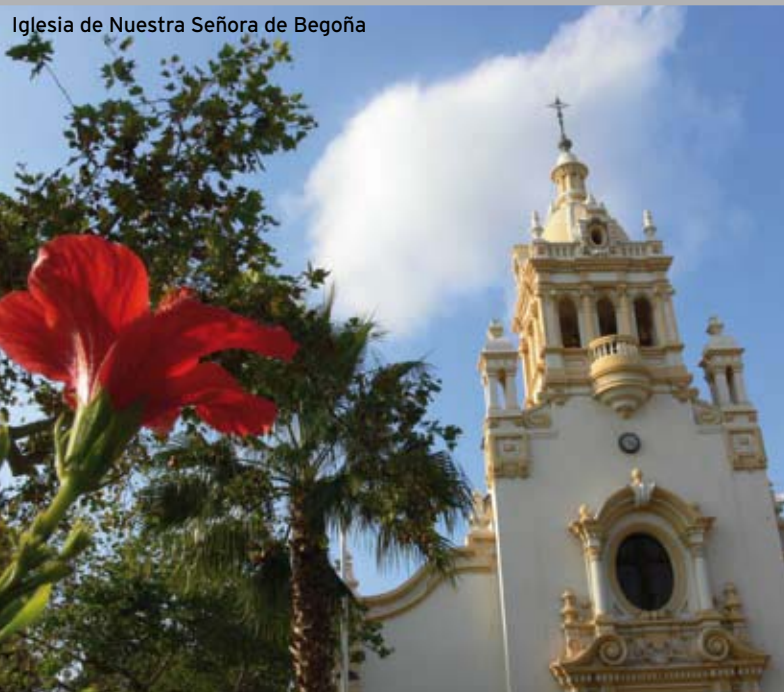
Iglesia de Nuestra Señora de Begoña